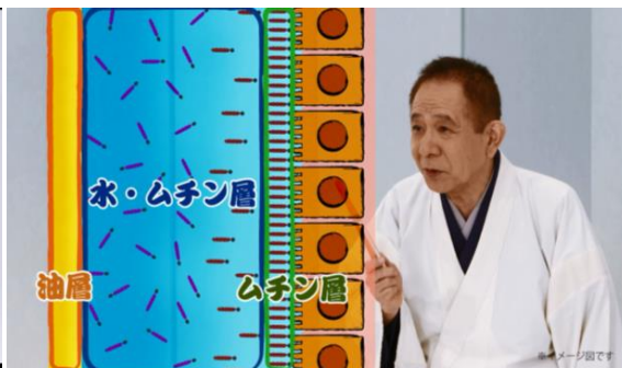
●その二「見過ごさないで。目の乾き」より