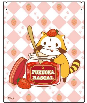
▲「福岡ラスカル」のミラー