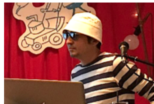
アラタ・クールハンド

平屋を使いHOME SHOPとして開業する人たちの例を、写真や動画を見ながら紹介。資金がなくなっても、心意気と実行力があればあなたにも新しく楽しい人生が拓けます！