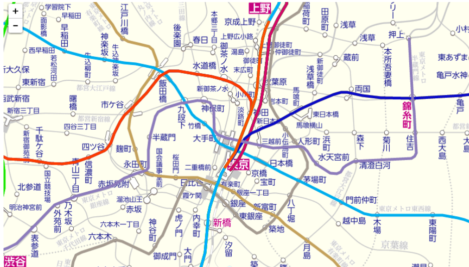
↑現在開発中の「駅すぱあと路線図」イメージ

現在、一部の法人のユーザー様にテスト利用いただき、近日の正式リリースに向けてさらなる品質向上・最終調整を進めています。