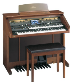
ミュージック・アトリエ AT-800