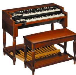
ハモンドオルガン XK-5