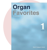
教材 “Organ Favorites” (山口綾規)