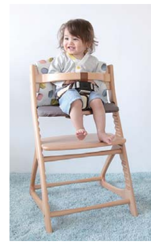
※クッション別売り