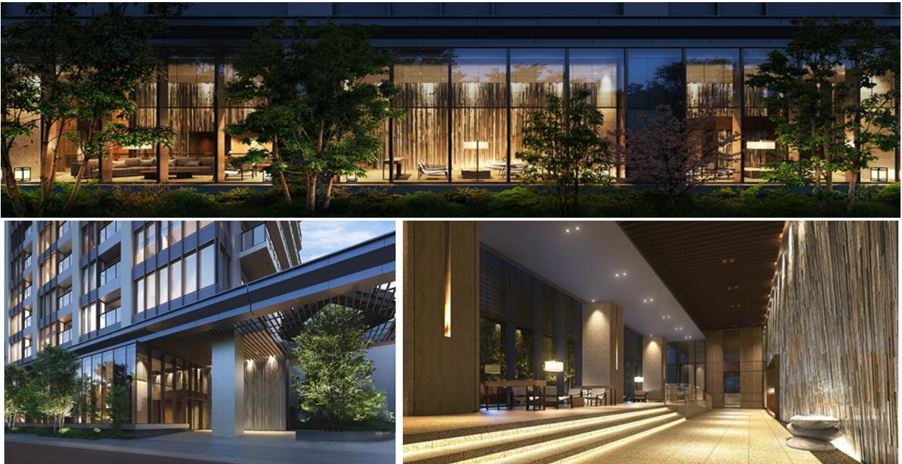
(イメージ/上：エントランスラウンジ、下左：エントランス、下右：エントランスホール)

この国の文化と伝統を受け継ぐ街にふさわしい、日本の粋を纏う装いのタワーとして、モダンな意匠に伝統美を宿すデザインで創られた閑雅な空間が落ち着いた雰囲気を演出します。