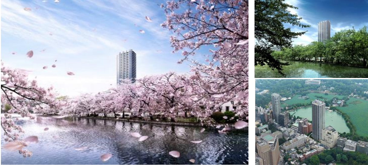
(外観イメージ/左・右上：四季折々の外観、右下：鳥瞰した本物件のイメージ)

東京国立博物館、国立西洋美術館等を擁する上野恩賜公園が目の前に広がる眺望の妙が住む喜びを更に豊かにします。また近隣に由緒ある寛永寺や東照宮、森鷗外や横山大観の元住居、東京大学や東京芸術大学といった大学など、芸術、文化、学問の施設の集まるこの地はしっかりと落ち着いた雰囲気、住環境も良質です。