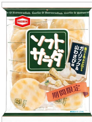
『18枚 ソフトサラダ ガーリック&山わさび味』

亀田製菓株式会社(本社:新潟県新潟市、代表取締役社長 COO:佐藤 勇)は『18枚 ソフトサラダ ガーリック&山わさび味(以下:『ソフトサラダ ガーリック&山わさび味』)を2016年7月25日(月)から2017年2月未までの期間限定で、全国にて販売いたします。