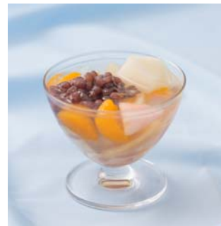
白桃入りあんみつ