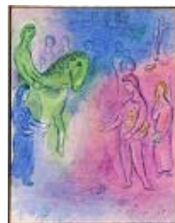
シャガール 「ディオニソファーネの到来」 ダフニスとクロエ1961年より

内容 日頃のご愛顧に感謝し、2週間にわたりサマーセールを開催します。国内外の巨匠の作品から新進作家まで、油彩画日本画・版画など幅広いラインアップで約100点を集め、特別奉仕価格にて展示販売します。