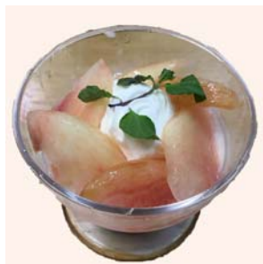
ピーチのヴェリーヌ

白桃を中心にパイナップル、みかんなどの果物とヘルシーな寒天、十勝産小豆の餡に求肥餅を添えました。