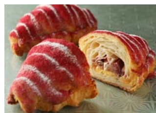
赤桃のクロワッサン

旬を迎える厳選した白桃とバラを使い、採れたてのフルーツのような香りと、滑らかな食感の特選ジュレです。