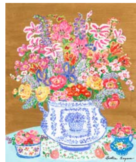
レスリー・セイヤー 「スプリングエンチャントメント」

内容 「花の画家」として世界中にファンを持つ、現代アメリカ人画家レスリー・セイヤー。アメリカ西海岸の海・風・光を感じさせてくれる風景画と豊かで鮮やかな色彩の花々の原画と版画約40点を展示販売します。