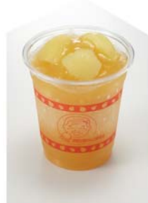
＜津軽完熟りんご研究会＞

『かたい信用やわらかい肉』がモットーの仙台で50年愛されてきた肉の専門店より、仙台牛のおいしさがたっぷり詰まったお弁当をご用意します。