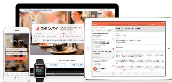
「スタンバイ」では検索窓にキーワードを入れると 400万件超の求人情報から検索できる

スタンバイは、国内の全業種・全職種・全雇用形態を対象にした日本最大級の求人検索エンジンです。スマートフォンなどの GPS 機能を活用した「地図」からの検索や、職種・業種などの「キーワード」と希望の「勤務地」を組み合わせた検索により、複数の大手求人サイトの求人を横断して一括検索できます。検索可能な求人件数は400万件を超え、いつでもどこでも、自分に合った求人を効率的に検索することが可能です。一方、企業や地方自治体、各種団体は無料で求人ページを作成・公開・