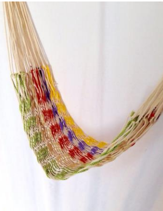
ハンモック制作ワークショップ