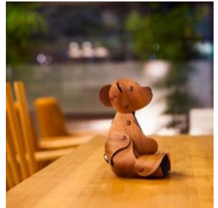
親子で楽しめるワークショップ

日本最大級のハンドメイドマーケットプレイス「Creema」( http://www.creema.jp )は、2016年7月23日(土)・24日(日)の2日間に渡り、「 ハンドメイドインジャパンフェス 2016 」(以下、 HMJ2016 )を東京ビッグサイトにて開催します。