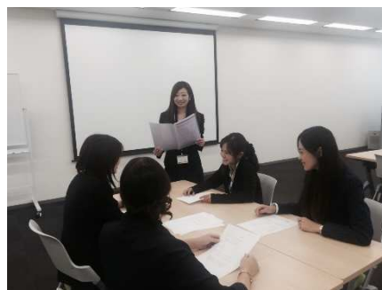
※研修前説明会の様子