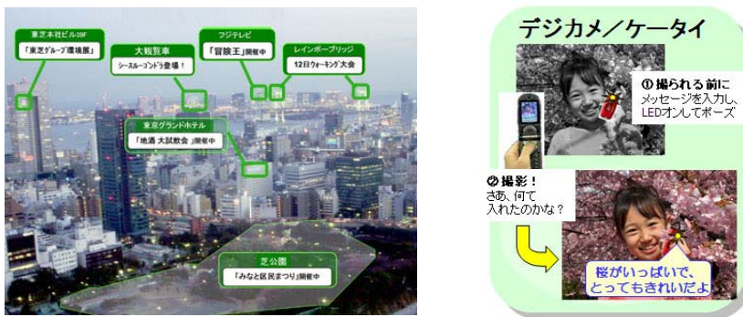
（左：多地点同時把握のイメージ画像、右：画像併用利用のイメージ画像）