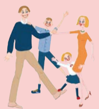
実際の配置が異なる場合がございます。