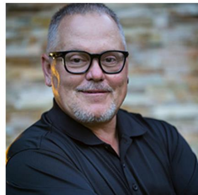
Parsons Xtreme Golf 創業者 Bob Parsons

1950年、米国メリーランド州生まれの65歳。1997年ドメインネームサービスプロバイダー、ウェブホスティングサービスの最大手となる GoDaddy 社を創業。2011年 GoDaddy 社の所有株式の一部を売却し、巨額の売却益により総資産 2.4 兆円を超える億万長者となる。現在も GoDaddy 社の最大株主であり会長を務める。他にも不動産事業、オートバイ・ディーラー、Scottsdale National Golf Club などの経営も行っている。