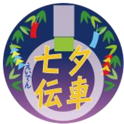
七夕伝車ヘッドマーク