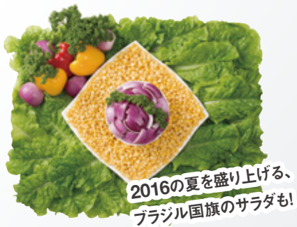
2016の夏を盛り上げる、 ブラジル国旗のサラダも!