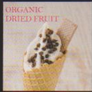
ラムレーズン&ドライフルーツ ¥450 RAM RAISIN & DRIED FRUIT 香りが豊かなラムレーズンを混ぜ込みトッピングはオーガニックのドライフルーツで砂糖コーティング無しの天然の日さ