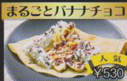
まるごとバナナチョコ ¥530 バナナ丸ごと1本使った1番人気の米粉クレープ