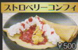
ストロベリーコンフィ ¥500 ストロベリーコンフィとクリームのシンプルな美味しさ