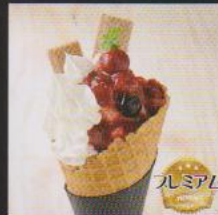
いちごのコンフィ ¥680 STRAWBERRY CONFIT 苺をたっぷりブレンドしたソフトに美味しい苺のコンフィを贅沢にトッピング Lサイズソフト