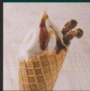
黒蜜きなこ ¥450 KUROMITSU KINAKO 「丹波の黒豆大豆きなこ」をたっぷり混ぜ込み濃厚な黒蜜とかりんとうをトッピング