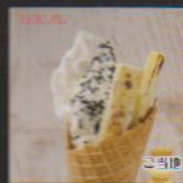
スイートポテト ¥450 SWEET POTATO 甘味の強い地元産のさつまいもをブレンドし、さつまいもスティックをトッピング