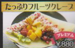
たっぷりフルーツクレープ ¥880 季節のフルーツをたっぷり使用したプレミアムクレープ

とやまの黒部米粉を使ったクレープです。ご注文を受けてからお作りいたしますのでお時間をいただいております。