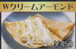
Wクリームアーモンド ¥450 ホイップとカスタードのWクリームにローストアーモンド