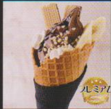
ロイヤルショコラ ¥680 ROYAL CHOCOLAT 3種類のスペイン産ビターチョコレートと独自にブレンド濃厚なカカオ感が風味を増す大人のソフト。バナナとナッツが絶妙バランス