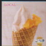
キャロット&オレンジ ¥450 CARROT & ORANGE 地元産のスイーツキャロットとオレンジの粗性が抜群のビタミンソフト