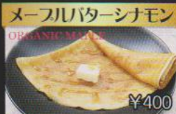
メープルバターシナモン ¥400 もちもち米粉生地とシナモンが大人の味わい