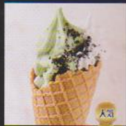
抹茶ラテ ¥450 MATCHA LATTE 農林水産大臣賞受賞の濃厚な抹茶にクッキー&クリームクラッシュとクリームをトッピング