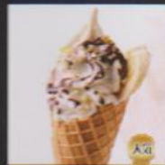
ナッツ&バナナショコラ ¥500 NUT & BANANA CHOCOLAT 完熟バナナをパナにブレンドしチョコソースとクリーム&ナッツのトッピング