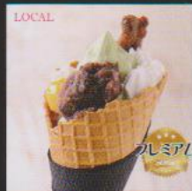
能登大納言抹茶栗あんごころ ¥680 MATCHA KURI ANKORO 農林水産大臣賞受賞の濃厚抹茶に能登大納言を贅沢にトッピングしたプレミアム