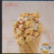
塩キャラメルポップコーン ¥480 SALTED CARAMEL POPCORN 地元産の塩を使った甘しょっぱいソフトに塩キャラメルポップコーンのトッピングで大活躍をイメージしました。