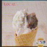
能登大納言あんごころ ¥480 BEAN PASTE 能登大納言をたっぷりまぜて贅沢に能登大納言とホイップをトッピング