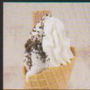
クッキー&クリーム ¥450 COOKIE & CREAM クッキー&パナをたっぷりブレンドした定番の人気商品