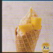
マンゴー&ココナッツ ¥450 MANGO & COCONUT マンゴーの果肉をブレンドし、マンゴーとローストココナッツをトッピングした南国トロピカルソフト