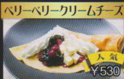
ベリーベリークリームチーズ ¥530 トリプルベリーにクリームチーズで相性抜群