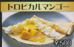
トロピカルマンゴー ¥500 甘〜いトロピカルなマンゴーで南国の気分