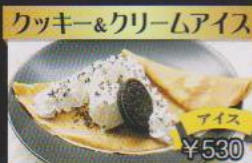
クッキー&クリームアイス ¥530 ビターブラックビスケットとアイスの甘味が絶妙