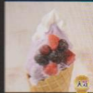
ブルーベリーベリー ¥450 BLUEBERRY BERRY ブルーベリーをたっぷり混ぜ込みシャリッとしたミックスベリーとクリームのトッピング 大人気商品