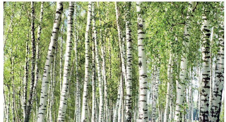
適切に資源管理された合法的なバーチ材(シラカバ)を利用しています。