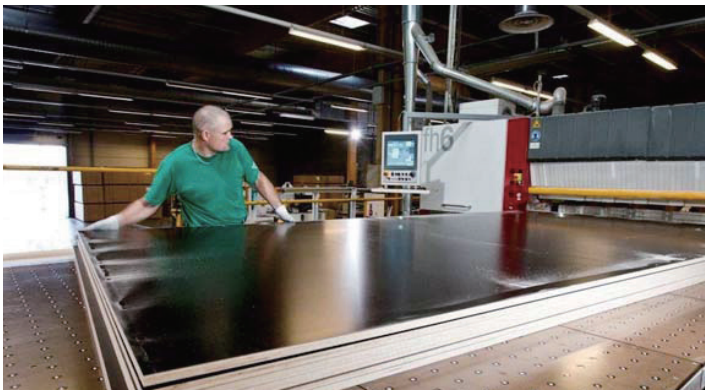
最新設備の導入された工場で製造されています。

(注1) PEFCとは、世界的に認められている最も高いレベルの「合法木材」の認証制度です。持続的な森林資源の利用を進めるため各国で採用が広がっており、日本でも国や自治体等の公共事業を中心に、積極的に取り組まれています。