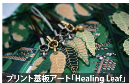
プリント基板アート「Healing Leaf」

すでに zenschool を受講した方々は、こんな製品を世に出しました！ (サービス)