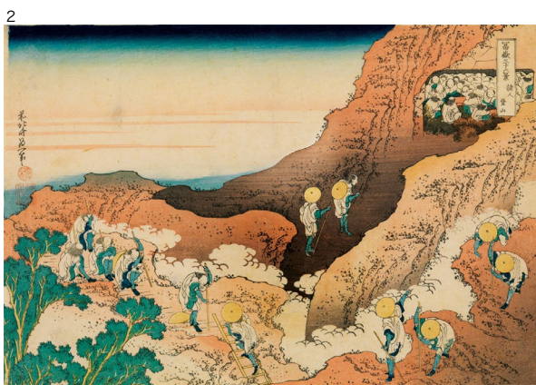
1：「富士山三十六景 凱風快晴」（作品を替えて通期展示）、2：「富士山三十六景 諸人登山」（前期） いずれも葛飾北斎画、すみだ北斎美術館蔵