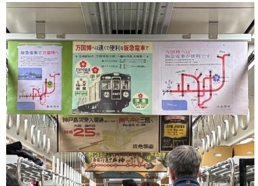
△ 『なつかしい！阪急電車の歴代中吊り広告展示』：共栄印刷株式会社（神戸市中央区花隈町 22-6）