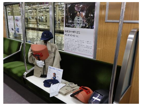
△ 『自分で刻印してオリジナル駅看板チャームを作ろう！』：株式会社神戸熔工（神戸市須磨区鷹取町 1-1-35）