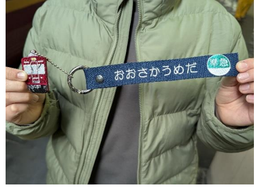
△ 『駅名標（縦）風の刺繍ネームタグを作ろう！』：金川刺繍株式会社（神戸市長田区梅ヶ香町 1-13-5）