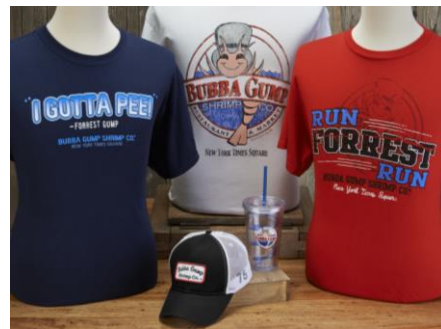
ババ・ガンプ・シュリンプ：Tシャツ、キャップ、タンブラー