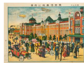
《東京名所 東京停車場之前景》