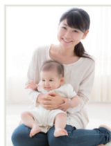
I.S様 女性 (30代)