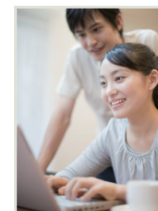
F.R様 女性 (30歳)

子供が出来てから家事が劇的に増え、掃除や洗濯物など家事が進まない毎日。とても手際良くお掃除して頂き、大変助かりました。サービスの間は、子供との充実した時間を過ごす事ができ、読みたかった本まで読めました!