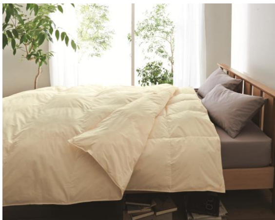
■洗える羽毛入り2枚合わせ掛け布団 <XY-404> シングル(150×210cm) 14,800 円(税抜) ダブル(190×210cm) 19,800 円(税抜)

今回発売する「洗える羽毛入り2枚合わせ掛け布団」では“肌掛け”のみに限定して羽毛を使用。「洗える羽毛入り掛け布団(2層式)」では肌に触れる“下層”部分のみに、羽毛を使用しています。どちらの商品も、肌に直接触れない“合い掛け”と“上層”部分の中わたには、ハイテク素材である“羽毛タッチわた「ネクストダウン®II」”を採用しました。羽毛の使用量を抑えることで低価格を実現しながらも、羽毛の心地良さを直接お楽しみいただけます。また、この仕様にする事で、羽毛入り布団ながら、ご家庭での洗濯が可能になりました。