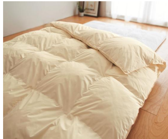
■洗える羽毛入り掛け布団(2層式) <XY-403> シングル(150×210cm) 12,800 円(税抜) ダブル(190×210cm) 18,800 円(税抜)