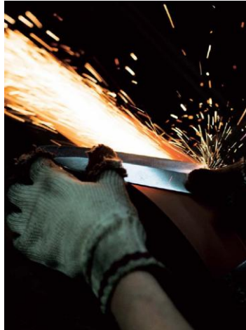
1分間に1700回転するサンドペーパーを使った平磨きは、刃を軽く当てた瞬間にオレンジの火花がぱっと飛び散る。

堺の包丁は、現在も親方制度のもと、職人が鋼材をハンマーで叩いて締める伝統的な製法を守っています。15を超える鍛冶工程が全て人の手で行われ、その全てに熟練の技を要する為、現在は鍛冶（叩き締める）、刃付（研ぐ）、柄付の3つに分業化されています。