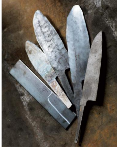
カットした鋼材を、焼いてハンマーで叩き締めて整え、包丁の形状を持たせる。

2013年に和食が世界文化遺産になったこともあり、世界のスーパーシェフから注目されている日本の包丁の中でも、和食料理人の約9割が使用していると言われる「堺包丁」。DAMA CASA2014夏号では、特別企画「暮らしの美シリーズ」として、こだわりの詰まった伝統工芸品の堺包丁を発売します。