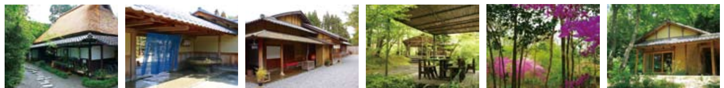
① 受付 ※生あも販売 ② 長屋門 ③ 山寿亭 ⑧ 川床テラスカフェ ⑨ 野の花観音径 ⑫ +plants プラスプラント

※期間中、自家用車でお越しのお客様は駐車料金1台につき1000円頂戴いたします。尚、駐車場ご利用のお客様には苑内で当日ご利用いただけるお楽しみ券(1000円分)をお渡しします。