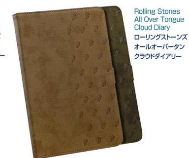
Rolling Stones All Over Tongue Cloud Diary ローリングストーンズ オールオーバータン クラウドダイアリー