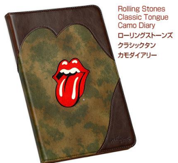
Rolling Stones Classic Tongue Camo Diary ローリングストーンズ クラシックタン カモダイアリー