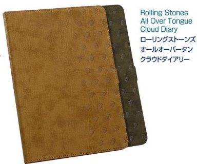
Rolling Stones All Over Tongue Cloud Diary ローリングストーンズ オールオーバータン クラウドダイアリー