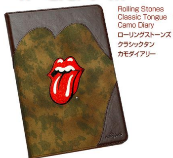
Rolling Stones Classic Tongue Camo Diary ローリングストーンズ クラシックタン カモダイアリー