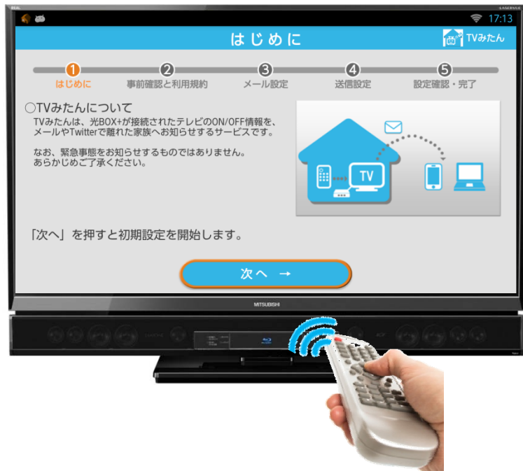
①毎日の“テレビ”の電源ON/OFF

■「見守りアプリ(仮称)」(無料)を利用することで、テレビ電源のON/OFF情報を光BOX+がキャッチし、お客様が指定したメールアドレスにメールでお知らせします。