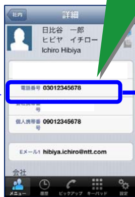
Web電話帳アプリ画面