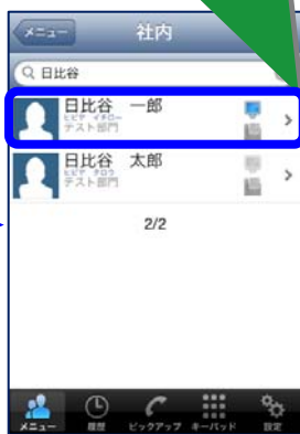
Web電話帳アプリ画面