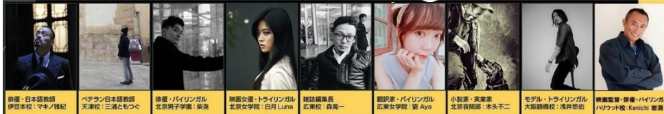
中国・日本語雑誌「Whenever」掲載誌面より