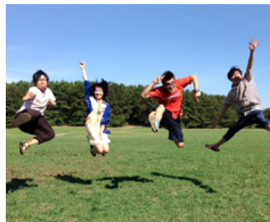
神聖かまてちゃん