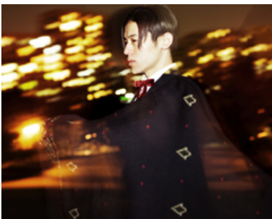
DE DE MOUSE