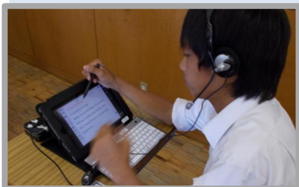
▲ 英語科 デジタル教科書を活用した 授業の様子