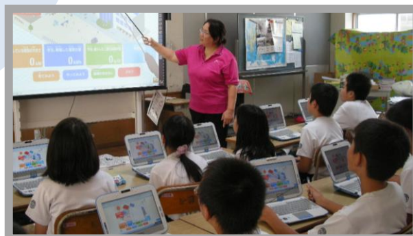
▲ 学校に設置された太陽光発電 に関する授業の様子