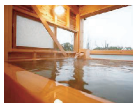
展望貸切風呂 「東雲」