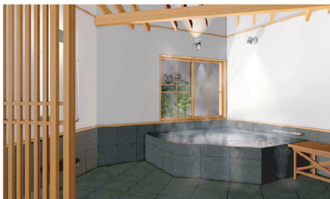
※新貸切風呂『木もれび』完成後イメージパース