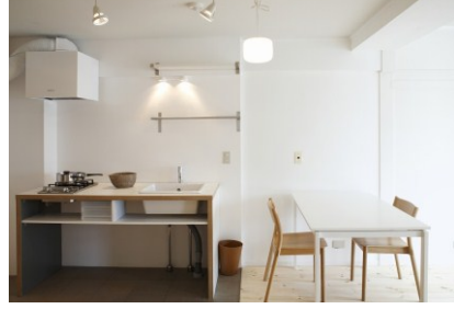
無垢のフローリングを利用した リノベーション物件 (幡ヶ谷)