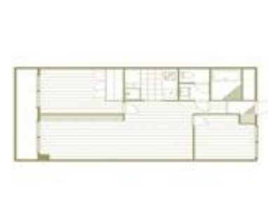
バストイレ別・個室あり 間取りのいいお部屋 (ときわ台)