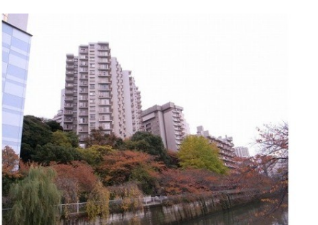
緑あふれる、目黒川に面した ヴィンテージマンション (目黒)