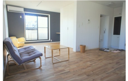
オーク材を使用した 高級感あるお部屋 (品川)