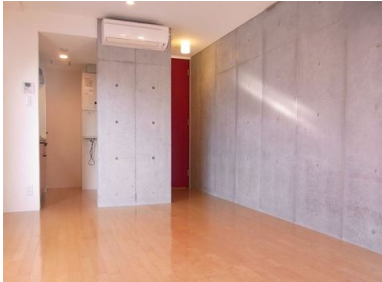
コンクリート打ちっぱなし デザイナーズ (祐天寺)