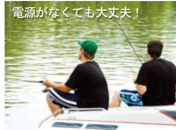
電源がなくても大丈夫！