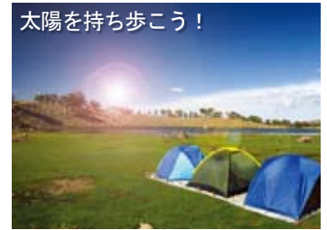
太陽を持ち歩こう！

薄くて軽く、胸ポケットやハンドバッグにすっきり入れられ、クリップ付きでベルトに掛けたり、持ち運びにとっても便利。