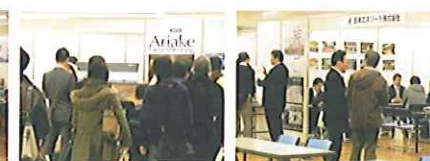
参加者は20～30代が約6割と若い方が多く、セミナーなどを熱心に聞かれる様子が目立ちました。

すべて日本の不動産企業との協賛というかたちで、「セミナー3回」「住宅フェア1回」を開催し、一定の成果を上げ経験を積んできました。