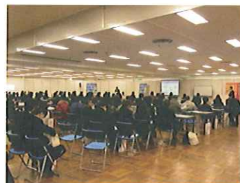
会場はほぼ満席状態