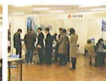
協賛企業様の個別相談ブースには相談希望者の行列ができるほど