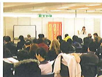
講師によるセミナーは熱心に傍聴