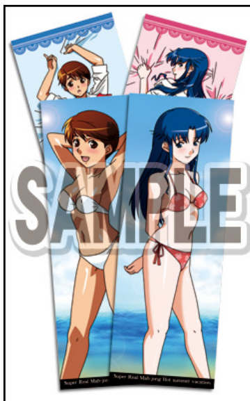
箱入りポスター みづき&綾(4枚セット)