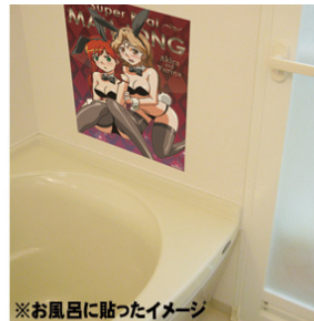
※お風呂に貼ったイメージ