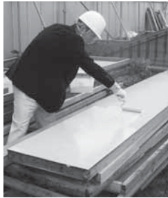
① 型枠に凝結遅延剤を塗布